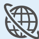
電気 / ネット環境工事