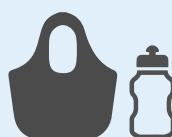
ノベルティの制作