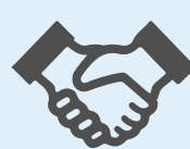
アフターフォロー

イベント基礎装飾から個別ブース、店舗内装にいたるまで。 グローバルネットワークをバックボーンにトータルプロデュース。