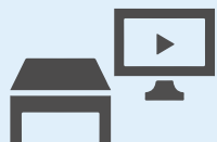
備品・機材の手配