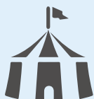
ブースデザインのご提案